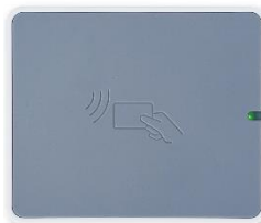
USB-Kartenleser zum Aktivieren und Lesen