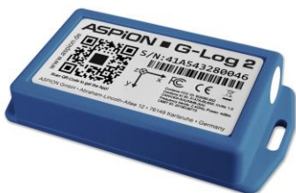
ASPION G-Log 2 Schocksensor zur Montage am Transportgut

Der Sensor ist in einem blauen ABS-Gehäuse mit Schutzart IP 50 und einer Membran an der Gehäuseöffnung vor Spritzwasser geschützt. Die Batterie kann vom Anwender selbst getauscht werden.