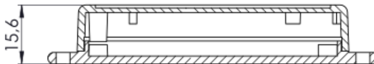
Maße in Millimeter