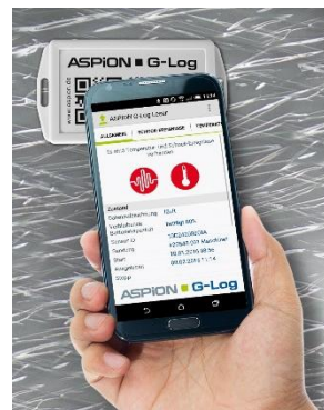
App für Smartphones zum Auslesen des Sensors mit NFC / BLE - für Android ab Version 4.4 und iOS ab Version 11