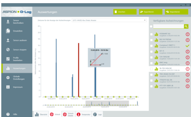
PC-Software ASPION G-Log Manager für Windows ab Version 7 zur Aktivierung, Steuerung sowie Analyse von Auswertungen